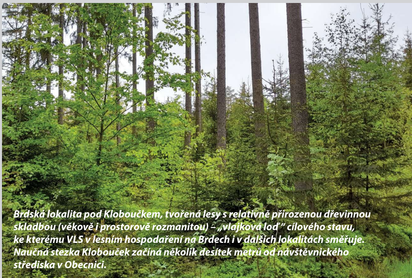
Brdská lokalita pod Kloboučkem, tvořená lesy s relativně přirozenou dřevinnou skladbou (věkově i prostorově rozmanitou) – „vlajková loď“ cílového stavu, ke kterému VLS v lesním hospodářství na Brdech i v dalších lokalitách směřuje. Naučná stezka Klobouček začíná několik desítek metrů od návštěvnického střediska v Obecnici.

U Vojenských lesů tak vznikl program lesní pedagogiky, která je zaměřená hlavně na práci s dětmi. Na každé z šesti lesnických divizí máme lesního pedagoga, který organizuje programy pro školy, zájmové organizace či letní tábory. Bere děti do lesa a vysvětluje jim, jak co v lese funguje a proč tomu tak je. Vedle toho vznikla celá řada aktivit pro veřejnost, která jim ukazuje naši přírodu, třeba jarní večerní výpravy za sovami, nebo práci v lese – závody tažných koní. Ale také přímo veřejnost zapojujeme do krajiny tvorby, což je příklad Brdského stromsázení, při němž mohou lidé