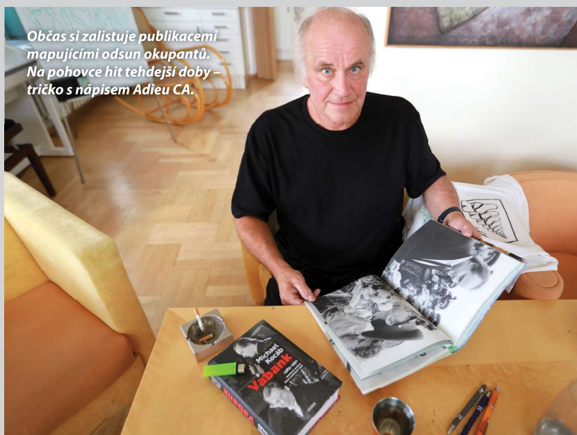
Občas si zalistuje publikacemi mapujícími odsun okupantů. Na pohovce hit tehdejší doby – tričko s nápisem Adieu CA.

„Mírnější skupina tvrdila, že ubytovat tak rychle 73 500 vojáků a téměř 40 tisíc jejich