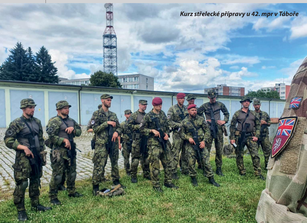
Kurz střelecké přípravy u 42. mpr v Táboře

Ve Spojeném království se teď rozvíjí několik oblastí, z pohledu českých veteránů velmi zajímavých. Jsou to například podpora bydlení a komunitní centra sloužící na pomoc veteránům.